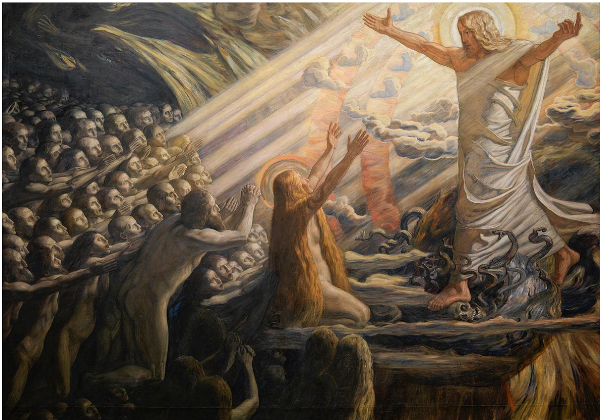
Jesus im Reich der Toten - Joakim Skovgard 1895 Die Umkehr Sadhanas